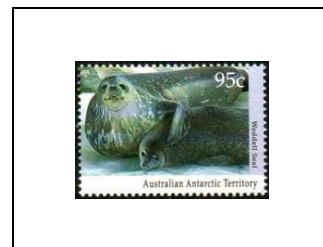
Phoque de Weddel