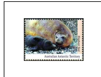
Eléphant de mer